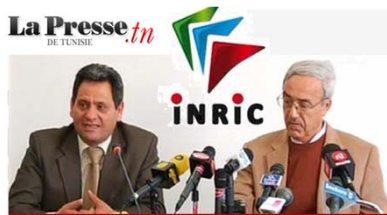
Nomination de six journalistes membres